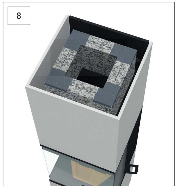
Speicherplatten mit letzten zwei Eckwinkeln sichern. Secure storage plates with the last two corner angles.