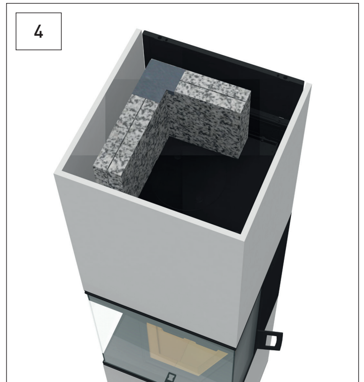
Speicherplatten mit einem Eckwinkel sichern. Secure storage plates with a corner angle.