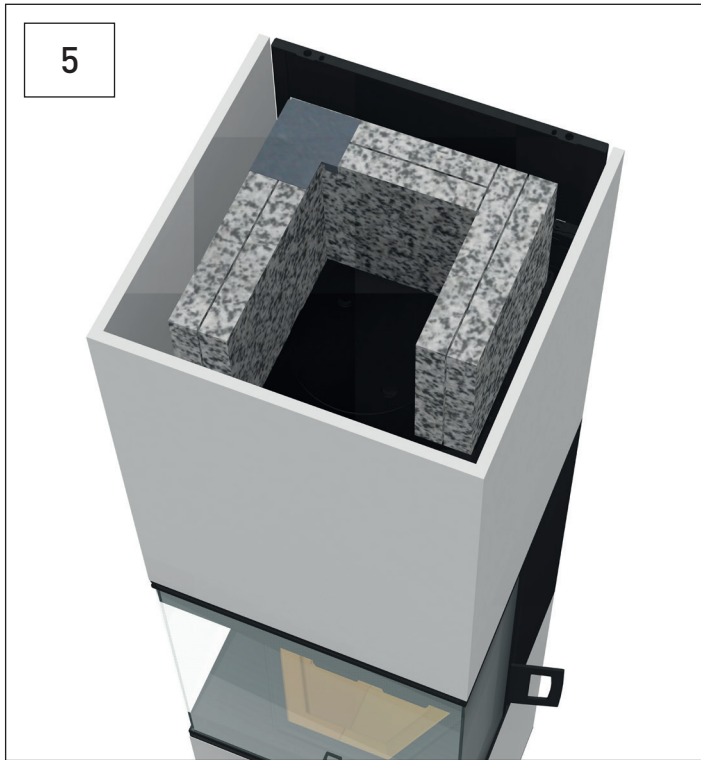
Zwei weitere Speicherplatten ergänzen. Add two more storage plates.