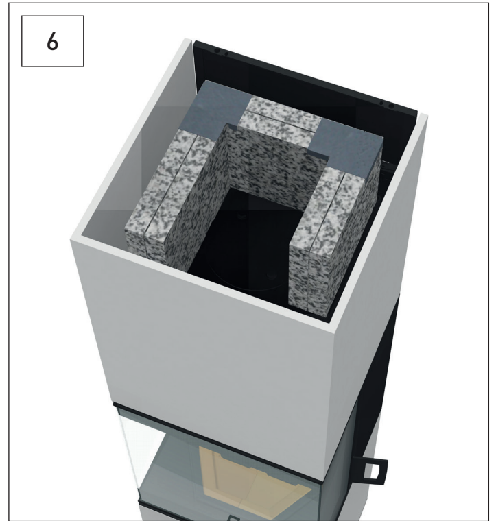
Speicherplatten mit einem Eckwinkel sichern. Secure storage plates with a corner angle.