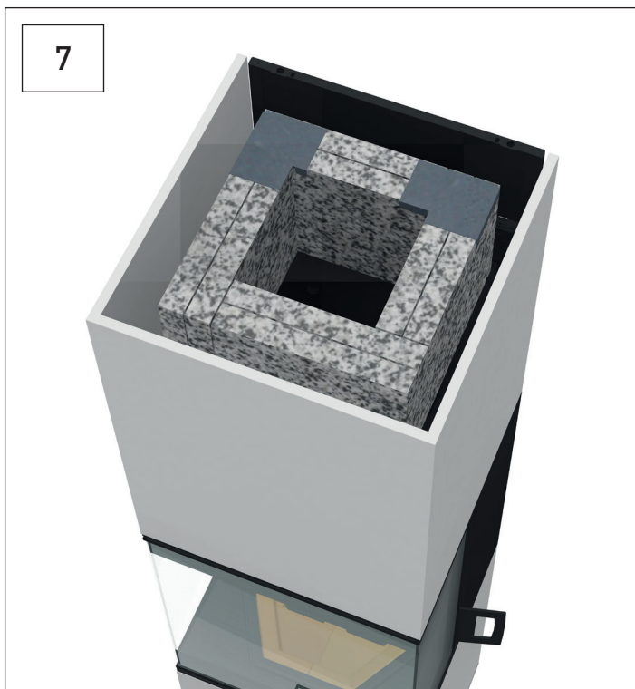
Die letzten Speicherplatten positionieren. Position the last storage plates.