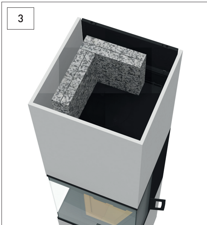
Vier Speicherplatten wie abgebildet positionieren. Position four storage plates as shown.