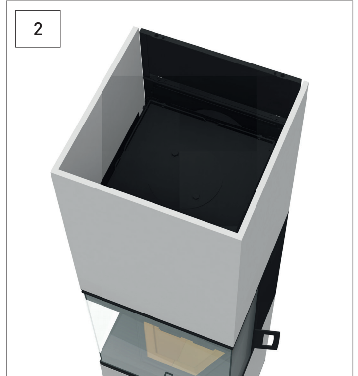
Ansicht von oben. Top view.